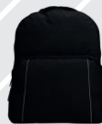
NEGRO JASPE /119