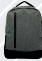
JASPE CLARO / 127